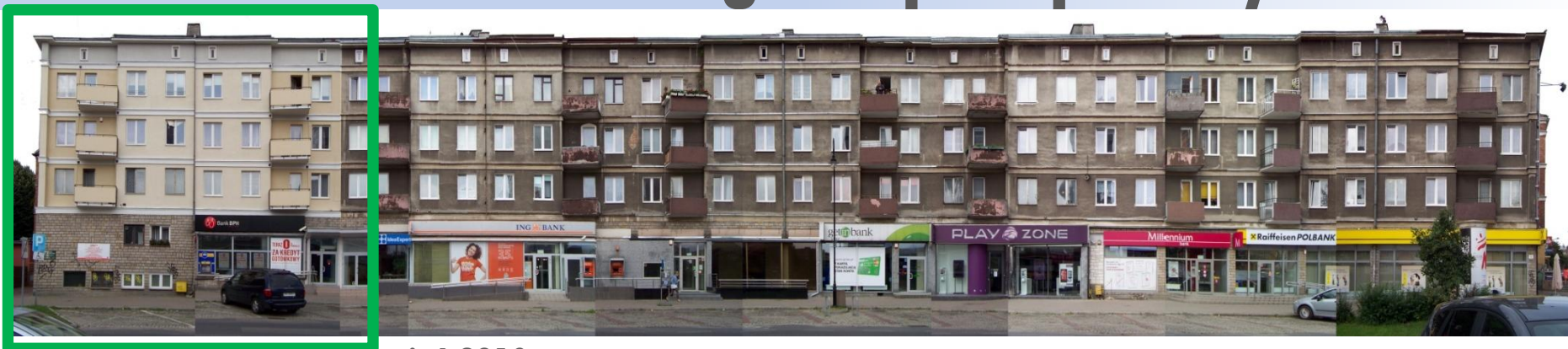
Ulica Rajská – stan na sierpień 2013 r.