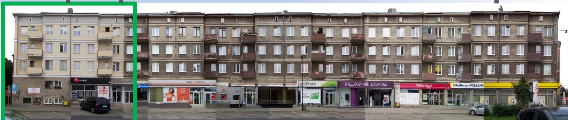
Ulica Rajska – stan na sierpień 2013 r.