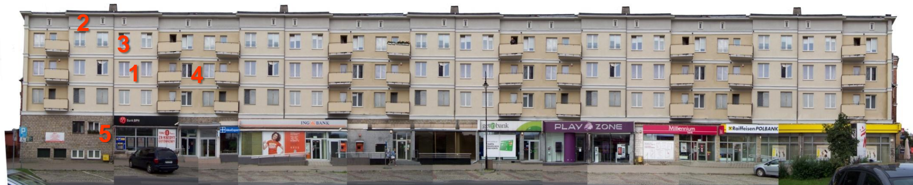
Ulica Rajská – projekt kolorystyki na podstawie wytycznych do planu

Ulica Rajská – ustala się kolorystykę nawiązującą do kolorystyki pierwszej sekcji budynku przy ul. Rajskiej