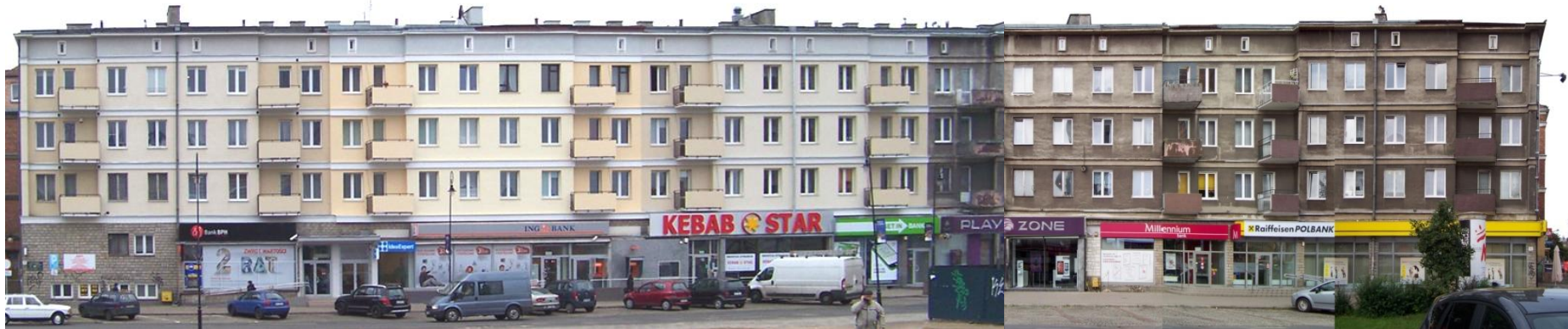
Ulica Rajska – stan na marzec 2014 r.

Ulica Rajska – realizacja kolorystyki na podstawie ograniczonej palety kolorystycznej w zbliżonej tonacji